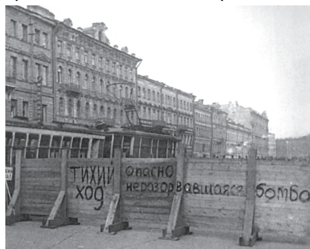
На улицах блокадного Ленинграда. Неразорвавшаяся бомба.