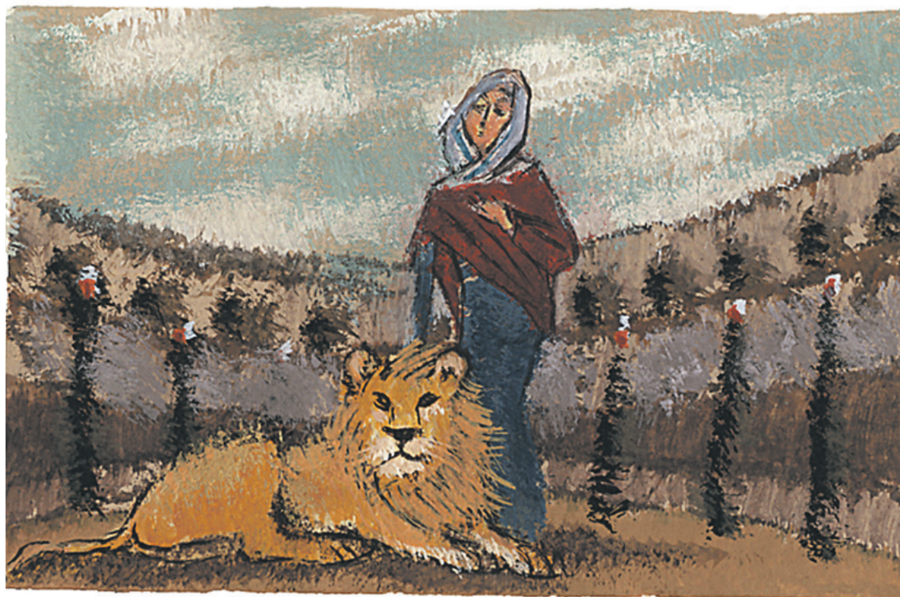
Святая мученица Татиана. Рисунок Валерии Неручевой

Однако Татиана, вопреки приказам, поклонилась в языческом храме Истинному Богу. И вдруг статуя Аполлона упала и разбилась на части. При этом все слышали вопль: закричал сидевший в статуе бес, принужденный бежать.