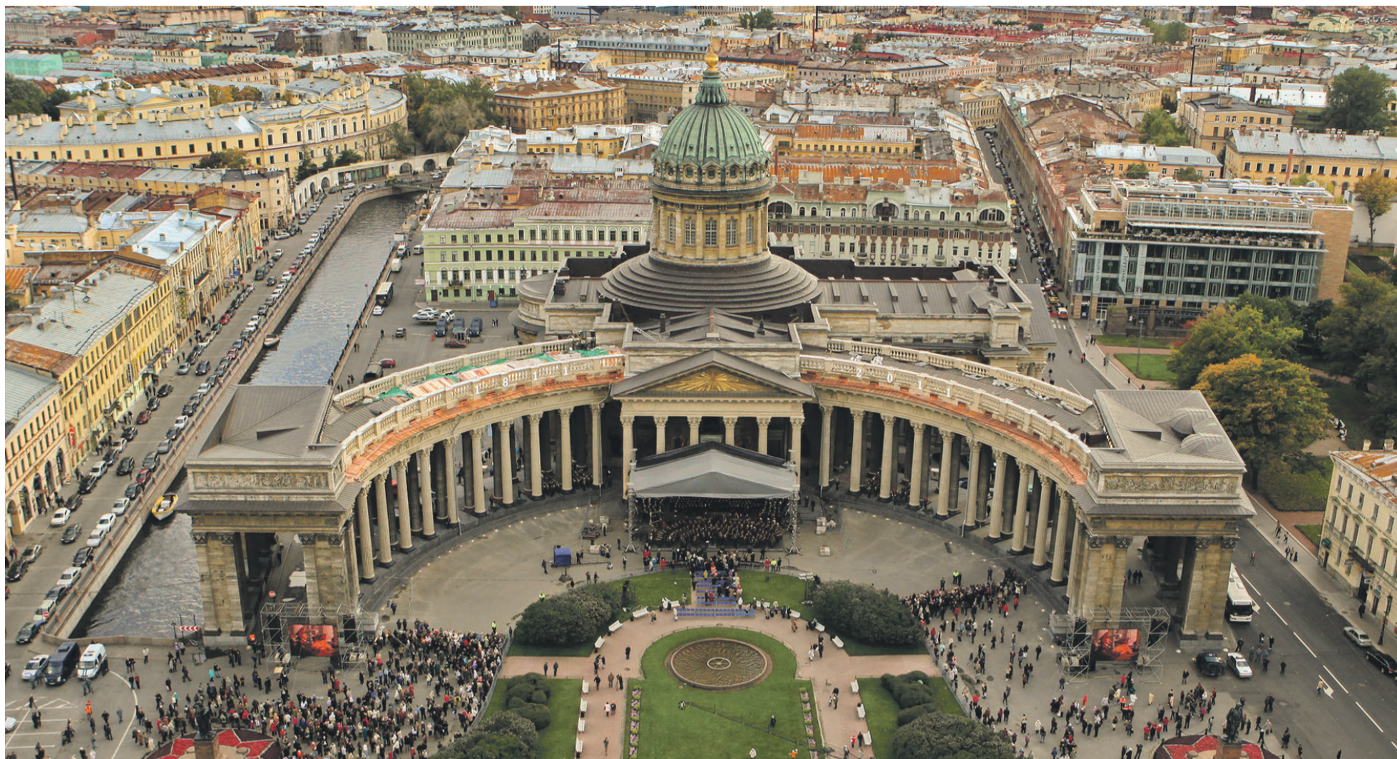
Казанский кафедральный собор