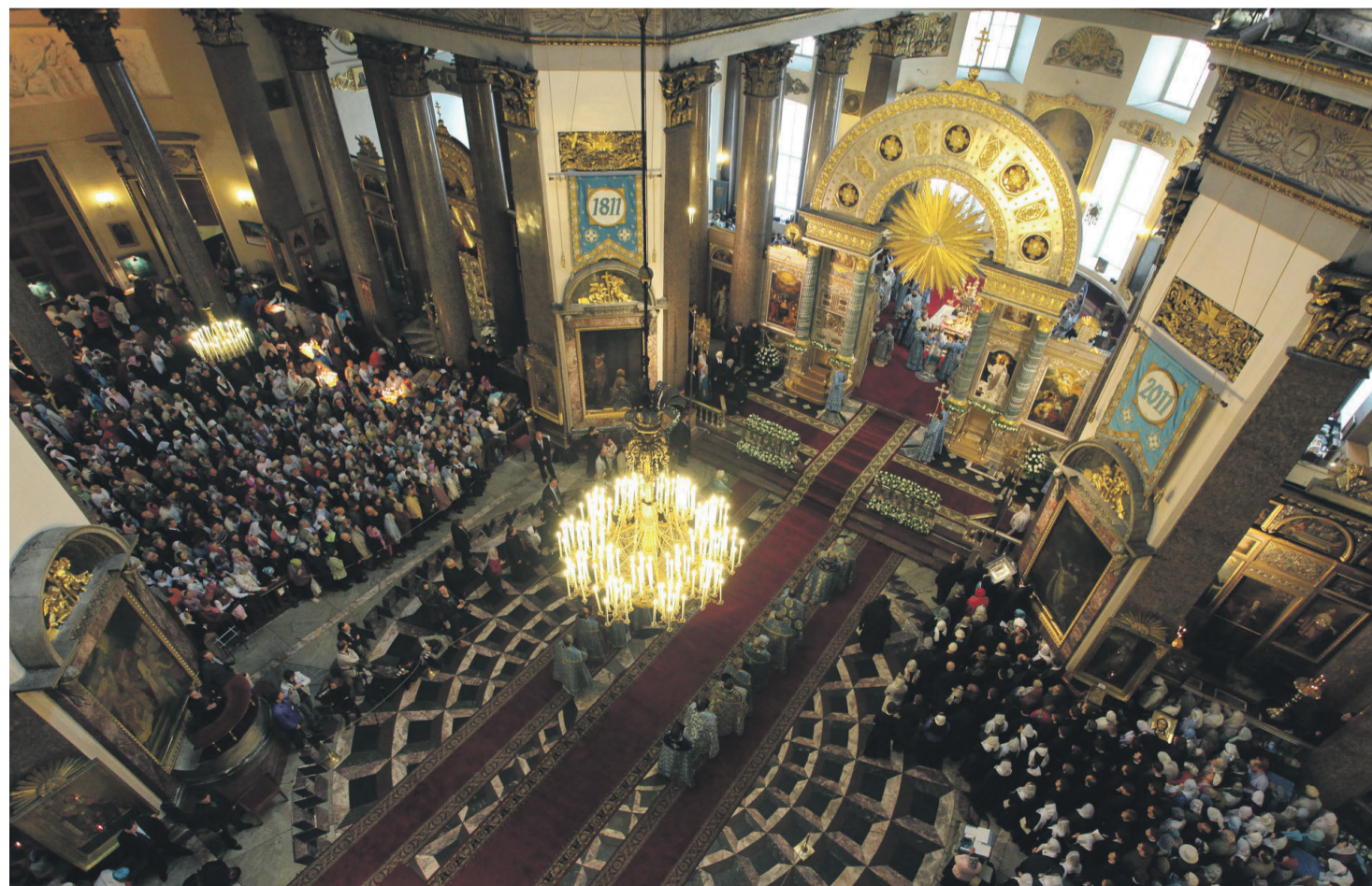
Внутреннее убранство Казанского собора

Икона является одной из самых почитаемых святынь православного мира. Наряду с Феодоровской иконой Божией Матери и иконой Знамения, Казанская икона считалась покровительницей династии Романовых. Празднование 300-летия династии Романовых в 1913 г. началось после литургии в Казанском соборе и молебна перед чудотворной иконой. До революции оклад иконы состоял из 4,5 килограммов золота, 3097 бриллиантов и алмазов, 155 изумрудов, 638 рубинов, 7 сапфиров и 1400 жемчужин. В советское время оклад был изъят. В дни блокады перед чудотворным образом возносились горячая молитва, как когда-то во время войн с наполеоновской Францией, Турцией и кайзеровской Германией. Молитвы были услышаны, и враг, по предсказанию святителя Митрофана Воронежского, ни разу не вошел в город.