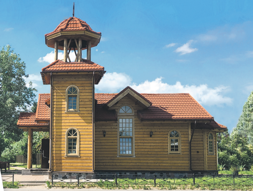
Газета прихода храма в честь святых жен-мироносиц. Приложение к газете «Казанский собор»