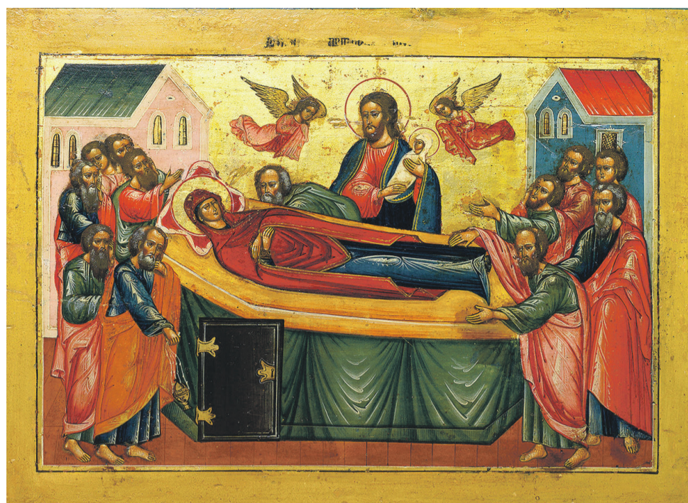
Икона Успения Пресвятой Богородицы

есть чин погребения плащаницы как зримый символ нашей веры в реальность ее смерти. Но уже в названии праздника кроется ключ к разгадке этой кажущейся дилеммы. Успение — именно это слово употребляет Церковь, говоря о конце земной жизни Пресвятой Девы Марии; это слово, в котором соединяются сон, блаженство, успокоение, мир, радость. В чем же радость, что так глубоко запало в душу Церкви, что именно это событие она прославляет с таким благоговением и такой любовью? Суть этой радости прекрасно передает икона праздника, которую полагают на аналой в центре храма. Один православный богослов так описывает ее: «На этой иконе изображена Божия Матерь на смертном одре, почившая. Вокруг Нее стоят апостолы Христовы, а над Ней — Сам Христос держащий в руках Своих Мать Свою живую и навеки с Ним соединенную. Таким образом, мы видим смерть и то, что уже соверши-