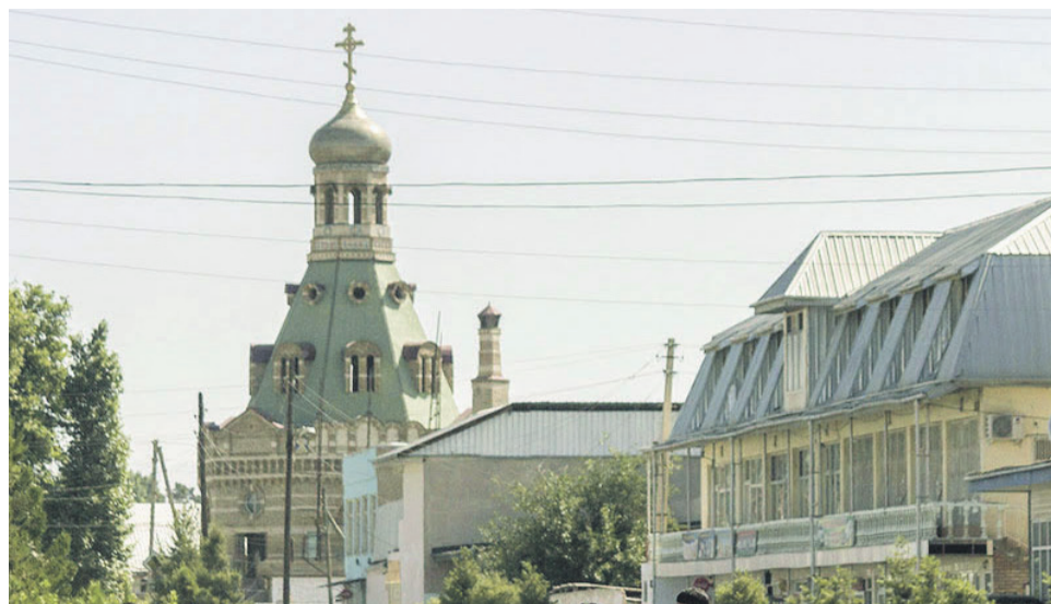
Храм Архангела Михаила в г. Курган-Тюбе

По поручению митрополита Смоленского и Калининградского Кирилла (ныне Святейший Патриарх Московский и всея Руси) была организована гуманитарная помощь районам, пострадавшим от стихийных бедствий в Таджикистане (2000 год) и Афганистане (2002 год). Мне было поручено техническое исполнение: подготовить списки, организовать питание, раздать одежду и т. д. По закону из Таджикистана нельзя было вывозить хлеб и мучные продукты. Как же передать продукты в Афганистан? Колонна уже организована, а разрешения нет. Я пришёл к начальнику таможни и сказал: «Если не разрешите вывоз продуктов, я выгрузу их на центральную площадь и раздам всем нуждающимся. И скажу, что местные власти не разрешили помочь афганским братьям». После этого выезд колонны разрешили. За