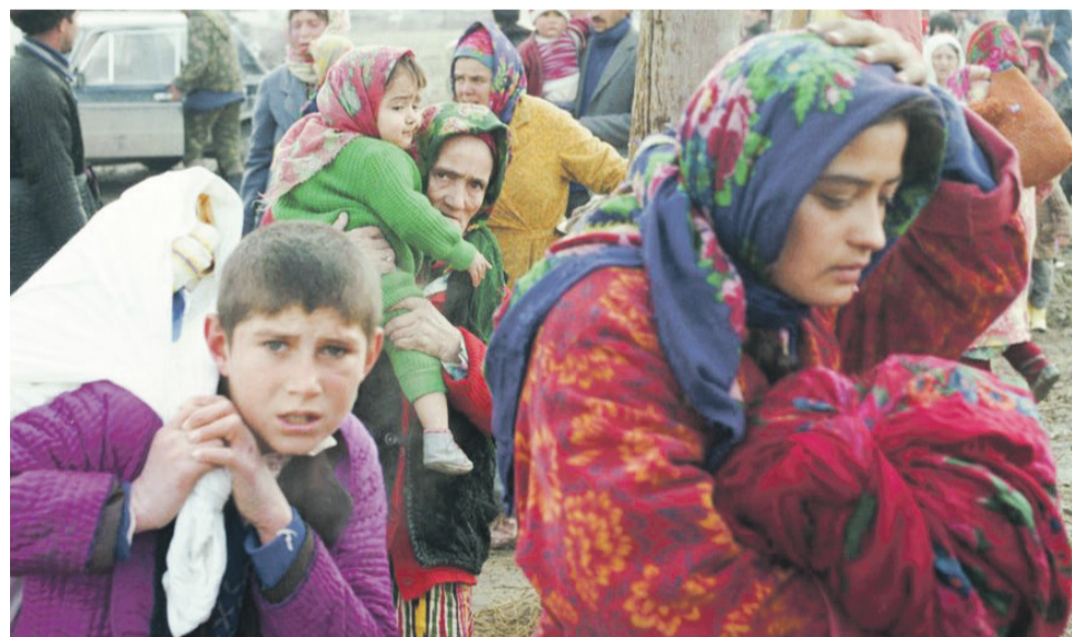
Таджикские беженцы. Гражданская война в Таджикистане 1992–1997 гг.

Наш храм был в эпицентре военных событий. В воскресной школе пуля пробила окно, попала в стену, загорелась настенная газета, но пожар дальше не распространился. Несколько ночей приходилось прятаться