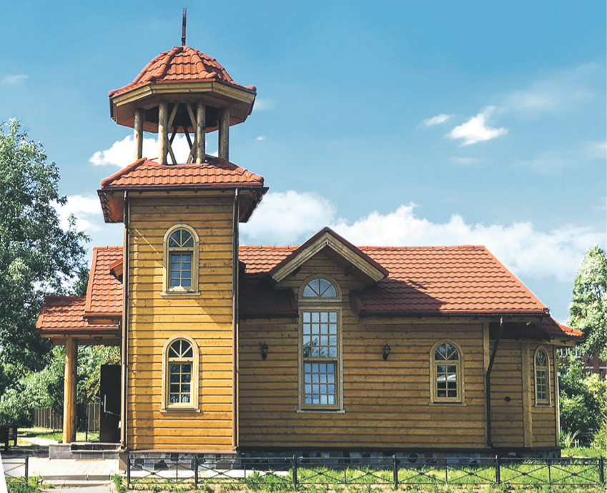
Газета прихода храма в честь святых жен-мироносиц. Приложение к газете «Казанский собор»