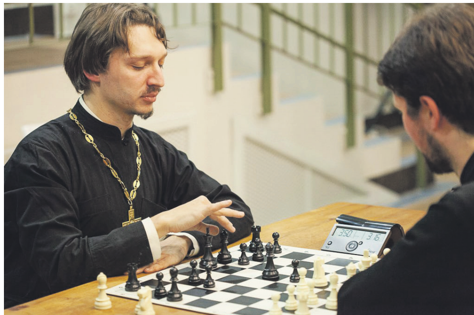
Партия с настоятелем — всегда испытание!

Мне стукнуло 12 лет. В один из выходных папа снова предложил мне сыграть с ним в шахматы. Эту партию, как и две следующие, я проиграл. Плакать я не стал, но огорчился до невозможности, а уязвленное самолюбие требовало отмщения!