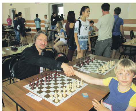
Отец и сын за шахматной доской

Такое было мое первое знакомство с древней игрой — игрой, которая волею судьбы, стала моим хобби, источником заработка и вообще, как сказал Поэт, «одной, но пламенной страстью». Но это было потом, а пока... пока я рос, учился в школе, ходил в спортшколу на отделение легкой атлетики и посещал художественный кружок Дома пионеров.