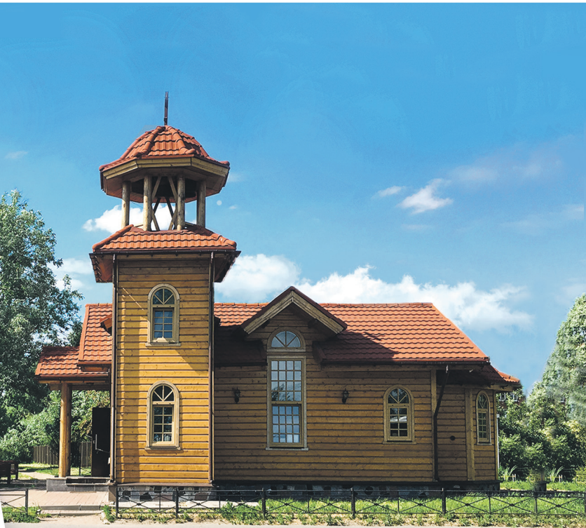
Газета прихода храма в честь святых жен-мироносиц. Приложение к газете «Казанский собор»