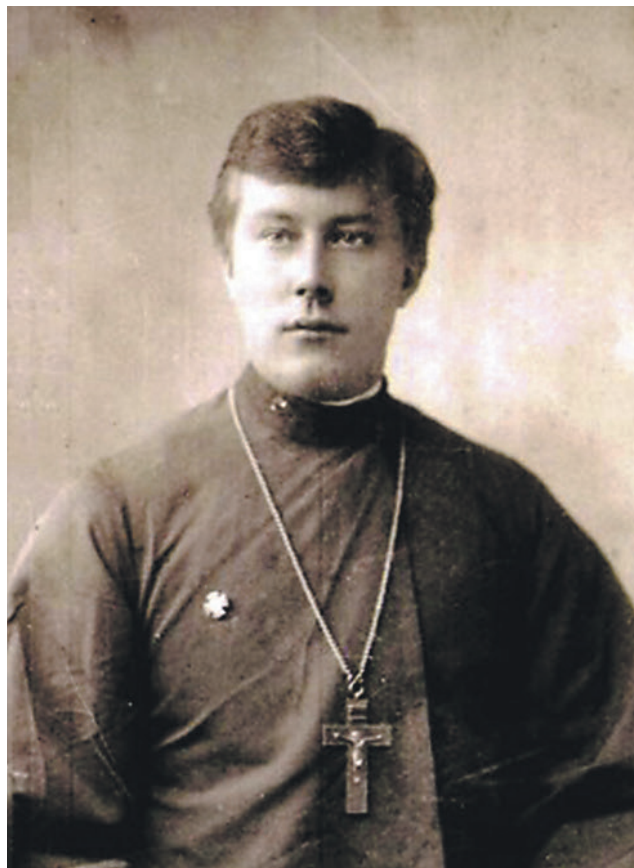
Священномученик Иоанн Кочуров, протоиерей