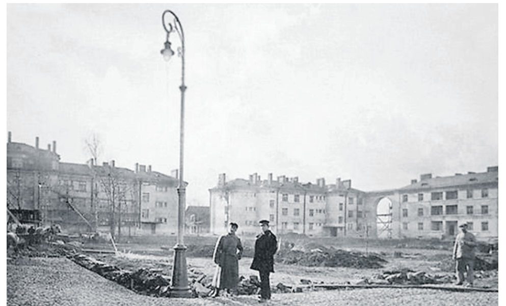
Начало строительства Серафимовского городка 30-е гг.