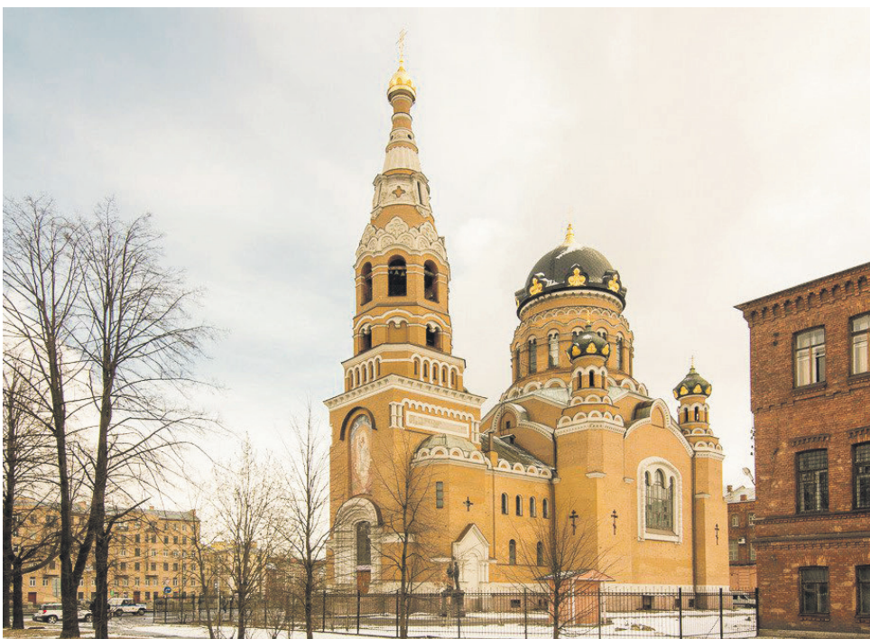
Храм Воскресения Христова на Обводном канале