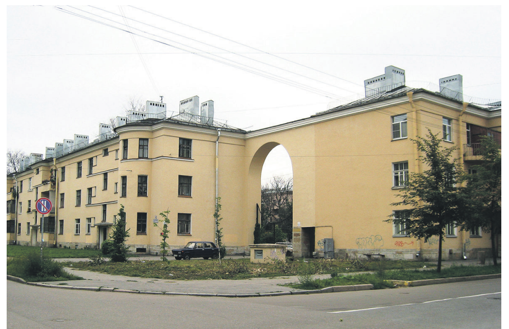
Серафимовский городок. Современный вид