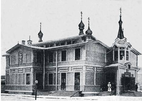
Храм Серафима Саровского

«Во дворе дома № 15 по ул. Белоусова с 1909 до 1930-х гг. стоял деревянный храм преподобного Серафима Саровского Общества распространения религиозно-нравственного просвещения. Храм, построенный по проекту архитектора Н.Н. Никонова, был перевезен сюда с Обводного канала, где его сменила Церковь Воскресения Христова (Варшавская церковь). В 1912 году храм сгорел, его заменили временным деревянным баракком с главкой, построенным по проекту арх. И.Т. Соколова. Планам строительства каменного храма было не суждено осуществиться. В 1930 г. храм закрыт».