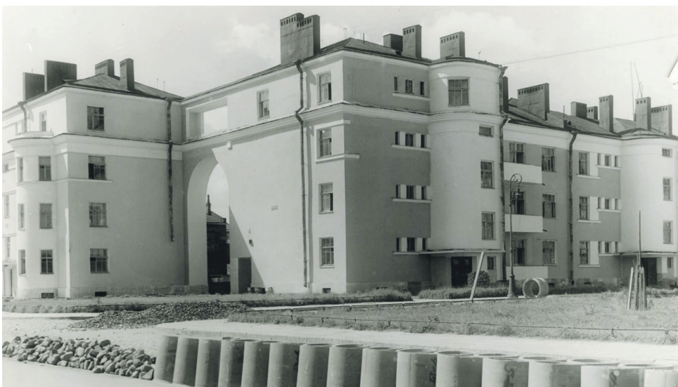
Серафимовский городок, 30-е гг.